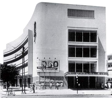
● CHEN CINEMA קולנוע חן