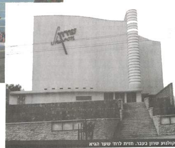
קולנוע שרון בעבר. חזית לוח' שער הגיא